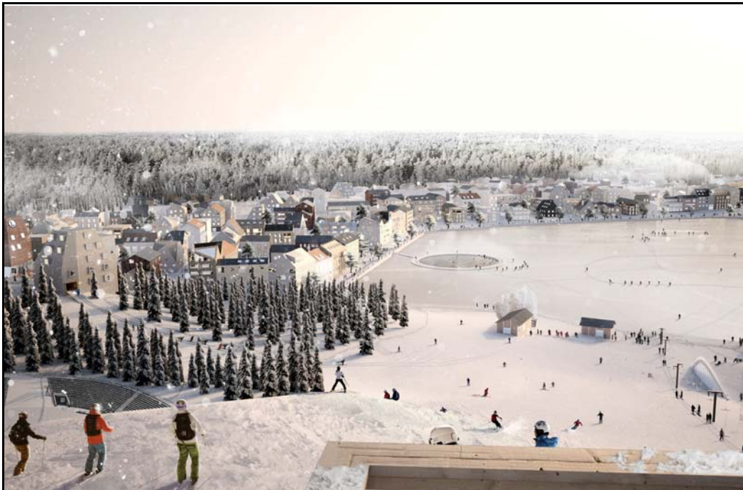
Visionsbild över gestaltningen i Väsjön Mellersta, bild: Dinell Johansson

För att genomföra förslaget på ett ändamålsenligt sätt avses några bestämmelser upphävas och några avses att ändras avseende dess innehåll. Övriga bestämmelser kommer att fortsätta att gälla parallellt med aktuellt tillägg. Ändringar av gällande bestämmelser gäller endast inom tilläggsbestämmeområdet.