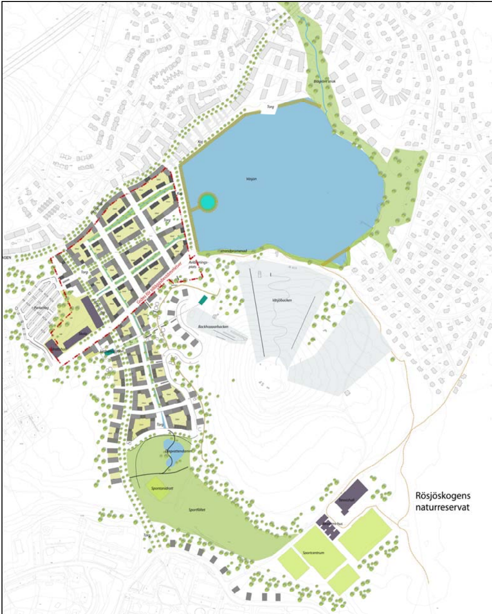
En småskaligare indelning av kvarteren med en blandning av flerbostadshus och stadsradhus

De stråk, som i underliggande detaljplan, är planlagda som mark för bostadsändamål och som får byggas över/ under med planterbart bjälklag avses att nyttjas som kvartersgator och som planterade, öppna dagvattenstråk. De öppna dagvattenstråken syftar till att på ett estetiskt tilltalande och naturligt sätt ta hand om områdets dagvatten så att de reningskrav som finns i underliggande detaljplan kan klaras. Dagvattenstråken kopplas samman med det öppna dagvattenstråk som går från dagvattendammarna på Sportfältet via Södra Väsjön ned mot Mellersta så att en sammanhängande dagvattenstruktur erhålls.