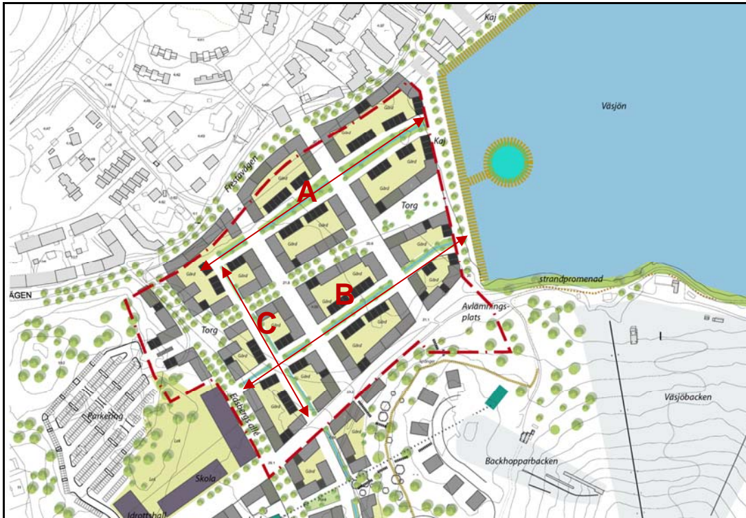
Illustration, visar de kvartersgator där kommunen är fastighetsägare

SEAB ansvarar för utbyggnad och drift av ledningar i form av fjärrvärme, VA, och el till förbindelsepunkt för respektive ledningsslag. Därefter ansvarar fastighetsägaren för utbyggnad och drift av servisledningar och övriga installationer. Gemensamhetsanläggningar kan bli aktuella inom kvartersmark då kvarteren kommer att delas in i flera fastigheter.